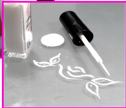
Smalto da Decoro Bianco