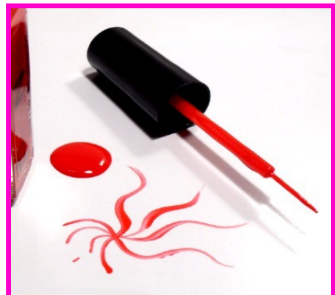
Smalto da Decoro Rosso