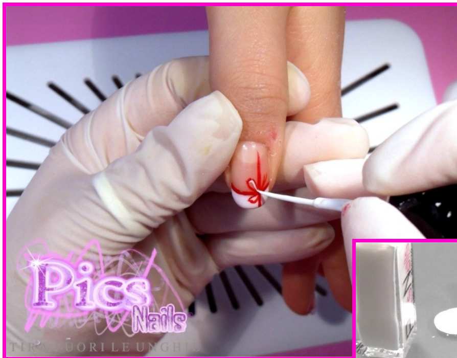
Decorare i Contorni Interni ed Esterni