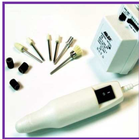
Fresa per Unghie Semi Professionale 1