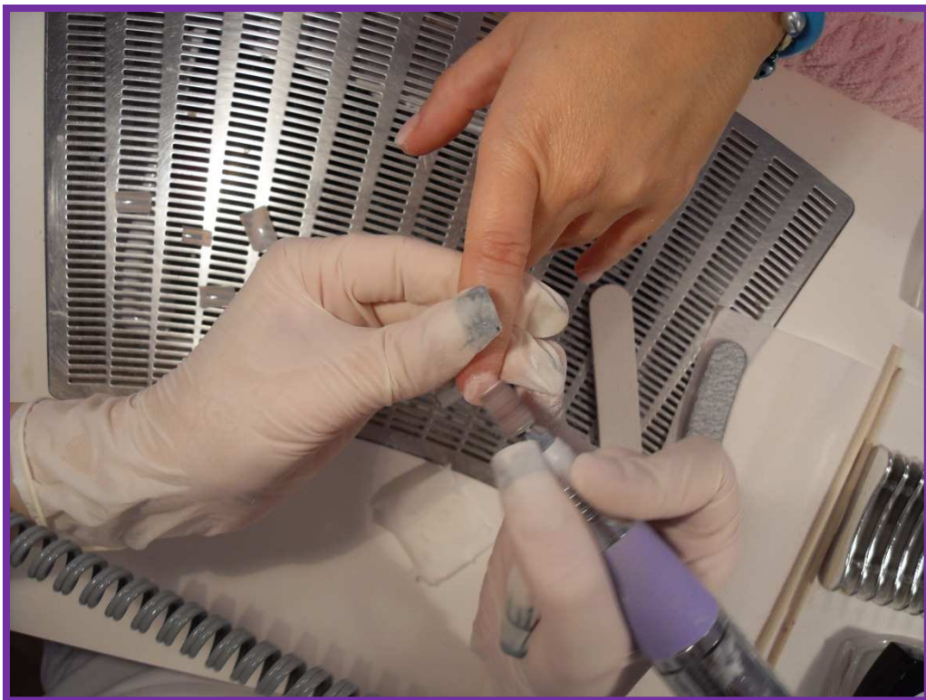
Particolare di Utilizzo della Fresa