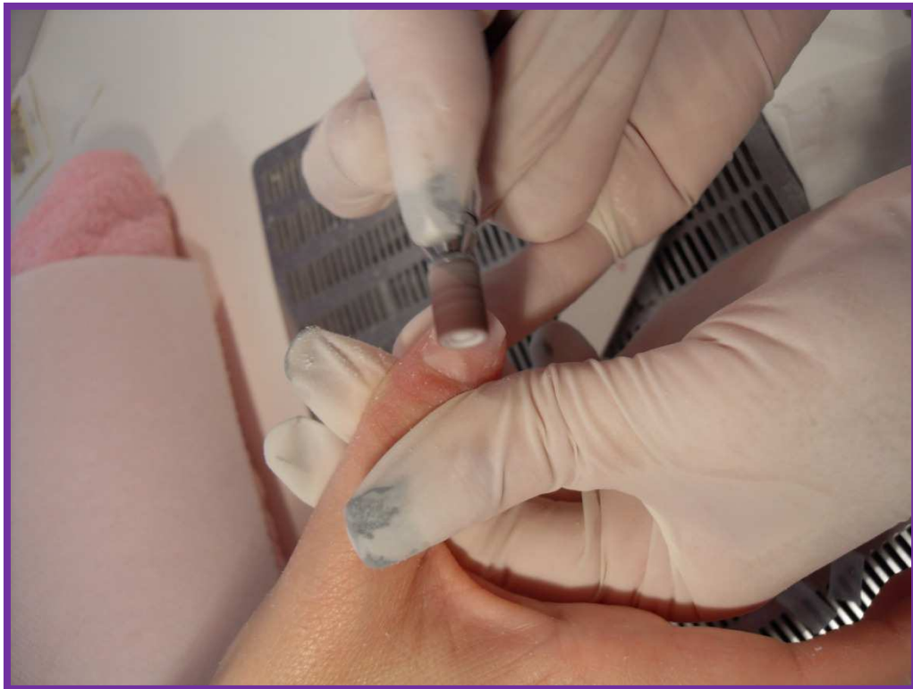
Fresa nella Creazione della Bombatura in Gel