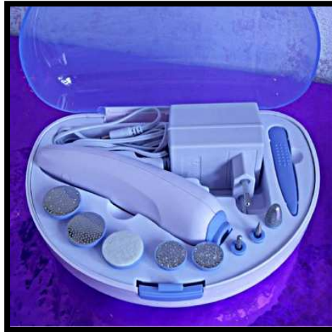
Fresa per Unghie per Hobbiste